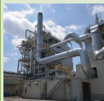
バイオマス発電所見学