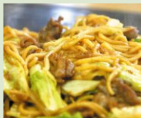
ひるぜん焼そば (イメージ)

2011年第6回 「B-1グランプリin姫路」 ひるぜん焼そば 好いとん会 ゴールドグランプリ受賞