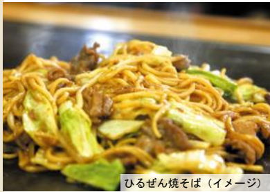
ひるぜん焼そば (イメージ)