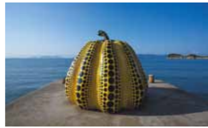
ベネッセアートサイト直島「南瓜」(草間彌生作)

地域固有のコンテンツを通じた広域連携への可能性と地域活性化への挑戦を高く評価された。